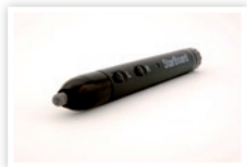
Электронное перо (опционально)