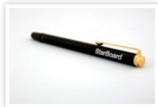
Сенсорное перо (стилус)